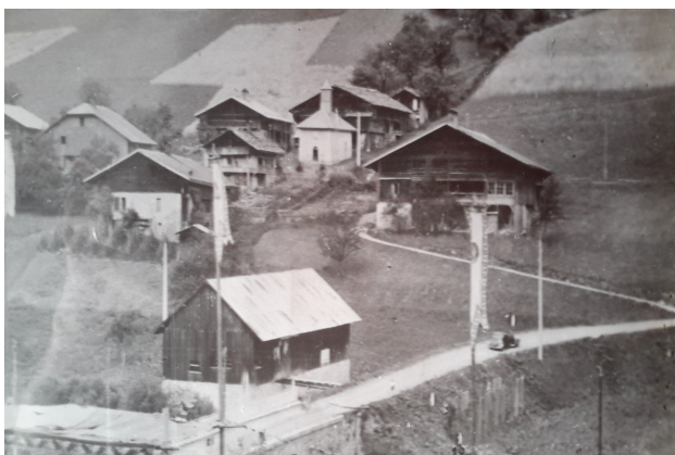
La scierie du Villaret

La famille Rochet poursuivra l'activité jusqu'en 2016.